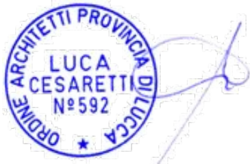
arch. Cesaretti Luca